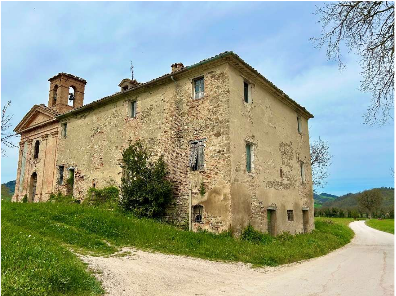
Chiesa di Sant'Eracliano.