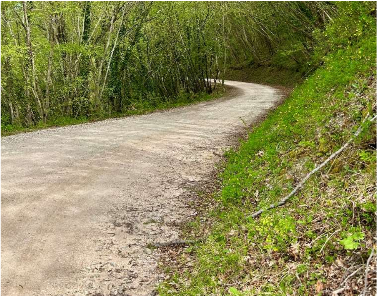
Percorso, interamente sterrato ma con un buon fondo stradale.

Urbania conosciuta fino al 1636 con il nome di Casteldurante , cambiò la propria denominazione in quella attuale in onore di papa Urbano VIII.